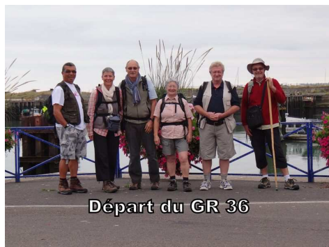
Départ du GR 36